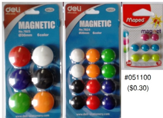
#7825 ($0.70) #7824 ($0.70)